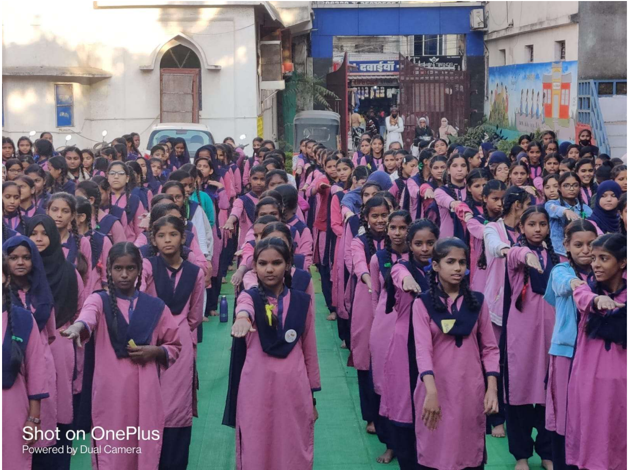
Shot on OnePlus Powered by Dual Camera