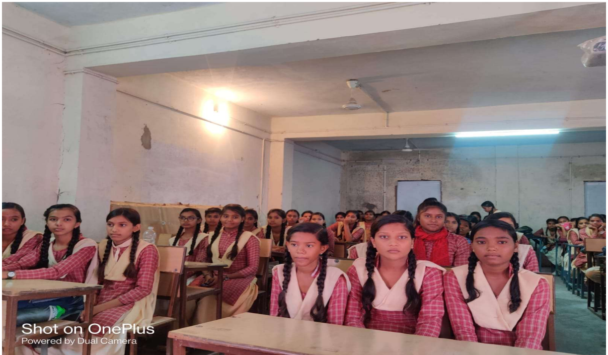
Shot on OnePlus Powered by Dual Camera